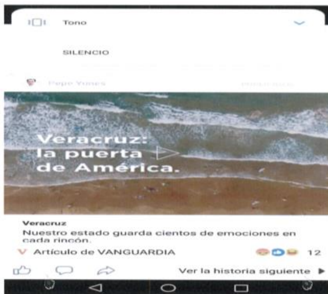
Imagen 4. Publicidad de índole electoral que circula en la red social denominada "Facebook", a nombre del C. Pepe Yunes.