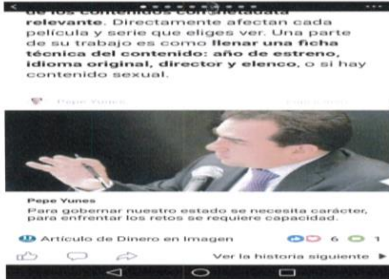
Imagen 7. Publicidad de índole electoral que circula en la red social denominada "Facebook", a nombre del C. Pepe Yunes.

A consideración de esta autoridad las imágenes 2, 3, 4, 5, 6, y 7 -pruebas técnicas- antes expuestas, no son suficientes para conceder la pretensión del actor respecto de las medidas cautelares solicitadas, de conformidad con la Jurisprudencia 4/2014 emitida por la Sala Superior del Tribunal Electoral del Poder Judicial de la Federación, la cual señala lo siguiente: