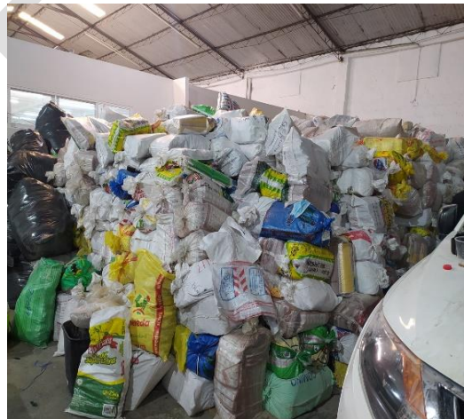
Imágenes 5 y 6. Cerrado de sacos con documentación electoral a destruir y colocación en los lugares de la bodega destinados para ello.