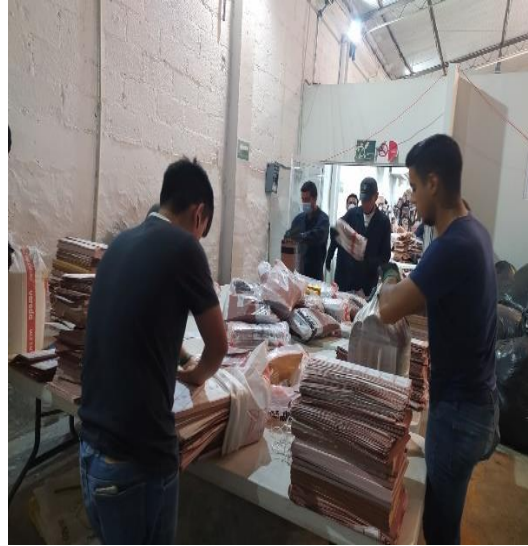
Imagen 4. Colocación en sacos de documentación electoral a destruir por personal de la DEOE y comisionado