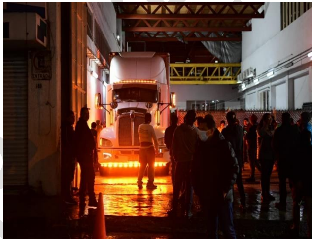
Imagen 10. Salida de vehículo de la bodega del OPLE Veracruz con documentación electoral a destruir para su traslado al lugar de destrucción.