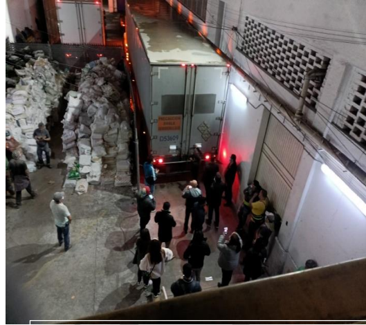
Imagen 9. Salida de vehículo de la bodega electoral del OPLE Veracruz con documentación electoral a destruir