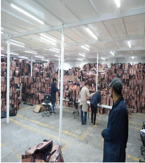
Imagen 3. Extracción de documentación electoral a destruir por personal de la DEOE y comisionado