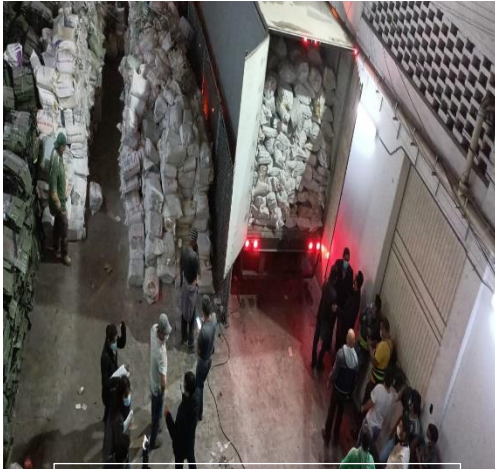
Imagen 8. Embarque de documentación electoral a destruir