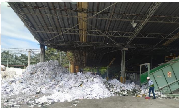
Imagen 13. Destrucción de documentación electoral en la banda en la que se realizó en instalaciones de BIO PAPPEL SCRIBE, S.A DE C.V