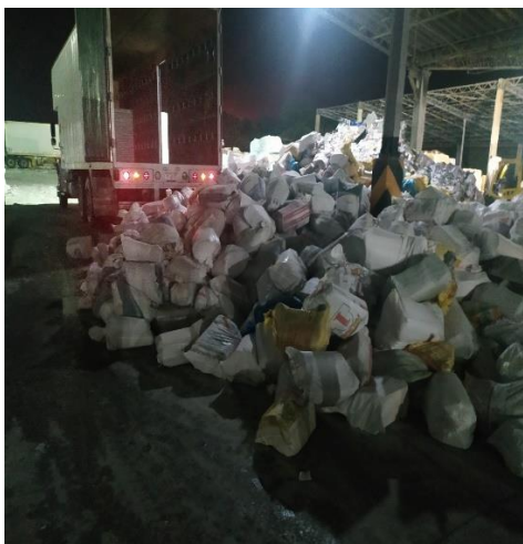
Imagen 11. Desembarque de sacos con documentación electoral a destruir en instalaciones de BIO PAPPEL SCRIBE, S.A DE C.V