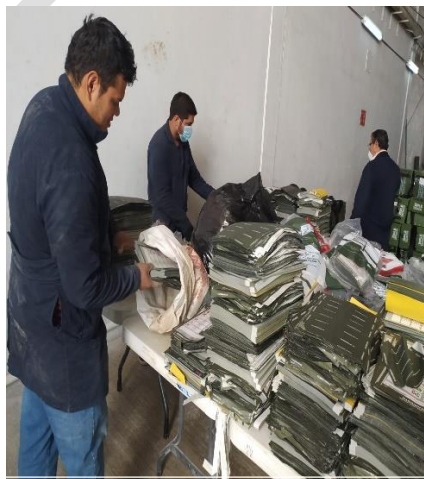
Imagen 2. Colocación en sacos de documentación electoral a destruir por personal de la DEOE y comisionado.