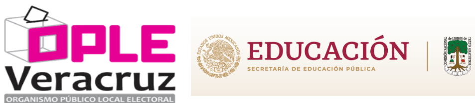
Imagen 7. El OPLE, Veracruz, suscribió contrato con CONALITEG, para que tal institución se encargara de la destrucción de la documentación electoral.

Así que, el 30 de noviembre de 2022, el OPLE Veracruz, por conducto del Secretario Ejecutivo, suscribió el contrato de donación número 1016-064-2022, con la CONALITEG con el objeto de efectuar la destrucción de la documentación electoral mencionada con antelación.