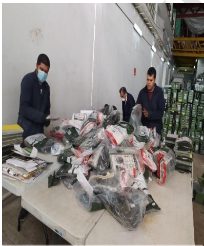
Imagen 1. Extracción de documentación electoral a destruir por personal de la DEOE y comisionado.