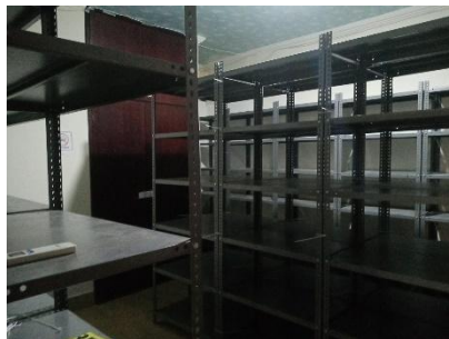
07 MTZ. DE LA TORRE