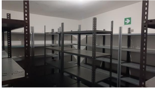
05 POZA RICA