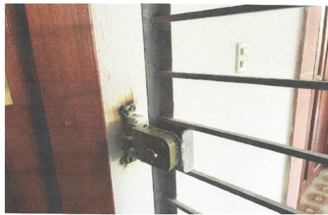
25 SAN ANDRÉS TUXTLA