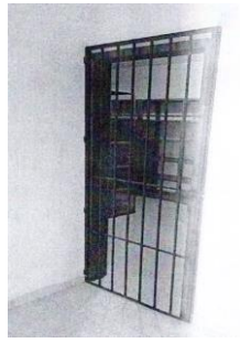
24 SANTIAGO TUXTLA