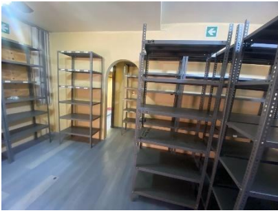
16 BOCA DEL RÍO