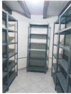
13 EMILIANO ZAPATA