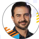
Miguel Ángel Yunes Márquez