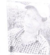
Diana. Creo que si podría ganar porque siempre gana el PRI.