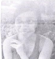
Cintia. Creo que si gana de nuevo porque así lo ha hecho la gente se acostumbró.