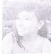
Angel. Si podría ganar porque la gente siempre vota por el PRI.