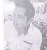
Angel. Si podría ganar porque hacen su trampa.