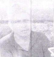
Alonso. Pienso que siempre va a ganar el PRI.