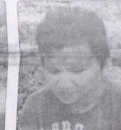
Oscar. Si gana porque el PRI predomina, sin importar el candidato y el dirigente.