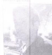
Edgar. Creo que siempre gana el PRI.