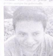
Elio. Pienso que si gana de nuevo, pero siempre gana, siempre se lo mismo.