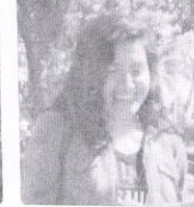
Elix. Podría ganar otro partido, pero siempre gana el PRI, aunque luego se cambian.