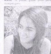
Sabina. Pues podría ganar el PRI pero por la costumbre, no por los cambios.