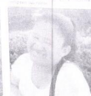
Guadalupe. Pienso que siempre gana el PRI.