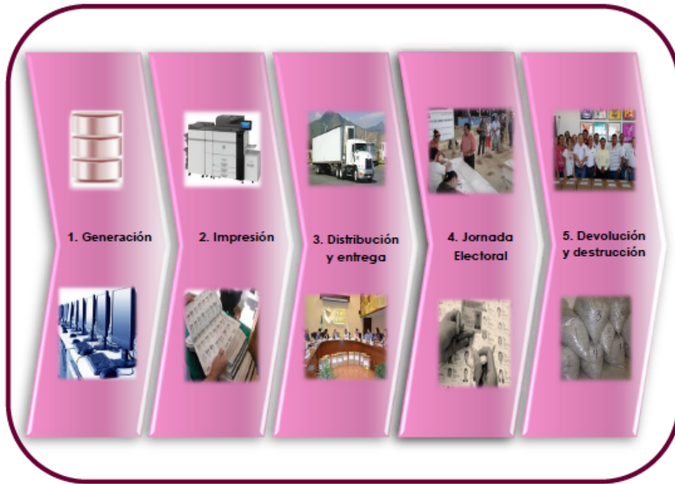
Figura 1. Flujo Operativo que considera el protocolo.

Fuente: Imagen del Anexo 19.3 del Reglamento de Elecciones del Instituto Nacional Electoral