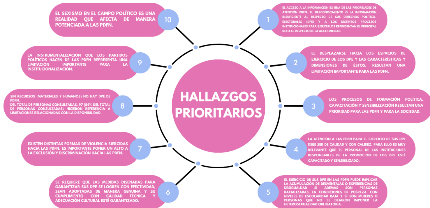
Figura 4. Hallazgos sobre los retos prioritarios

Finalmente, se plantean una serie de retos prioritarios definidos por el equipo de investigadoras a partir de la interpretación de los resultados generales. Cada reto prioritario indica un análisis entrelazando hallazgos de distintas dimensiones con una cuestión o tema en común y sustentado con los datos de los hallazgos. Se plantean una serie de recomendaciones a partir de la identificación de dichos retos.