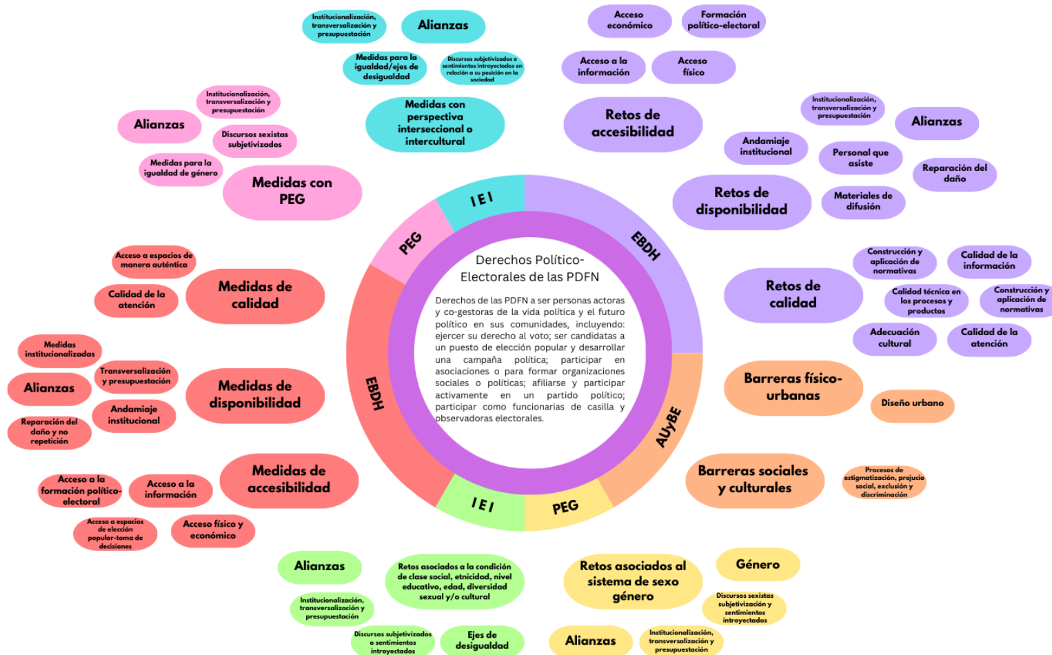
Figura 1. Modelo analítico de DPE de las PDFN.